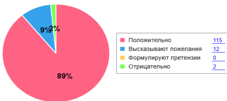
Как родители оценивают детский сад

Анкетирование родителей показало высокую степень удовлетворенности качеством предоставляемых услуг.